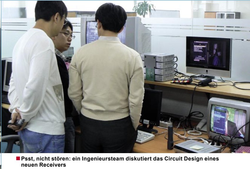
■ Psst, nicht stören: ein Ingenieursteam diskutiert das Circuit Design eines neuen Receivers