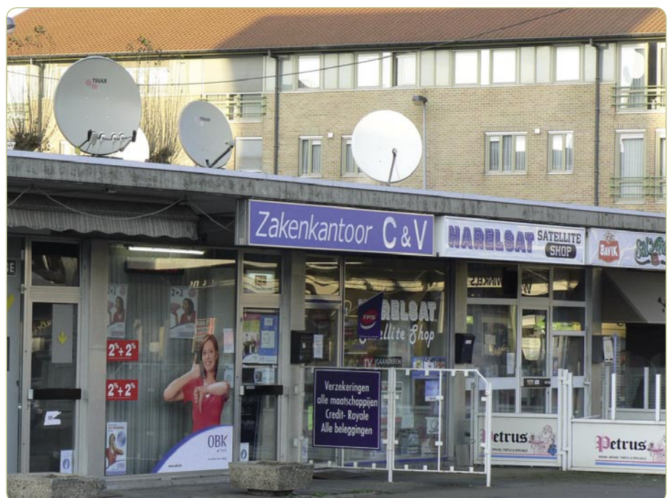
Der kleine Laden von Harelsat, in dem man von Dienstag bis Samstag von 9 bis 19 Uhr Komplett-Sets kaufen kann.

Bereits mehrfach hat der BSH Satellitenmessen abgehalten. Die letzte in 2006 lockte mehr als 500 Besucher, und 10 Aussteller, darunter Satelliten- und Kabelbetreiber. In 2007 ist eine weitere Ausstellung im Mai geplant, die diesmal Platz für 20 Aussteller bieten wird. Der BSH zeigt, dass Belgien zwar ein kleiner, aber äußerst aktiver Satellitenmarkt ist.