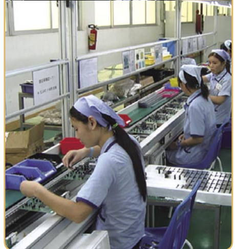
Blick in die Produktionshalle von ARION in DongGuan

ARION hat ein Motto; es lautet sinngemäß: durch Befriedigung der Kundenwünsche und durch gutes Management erzielt man den höchsten Wert für das Unternehmen. Und die Vision von ARION ist: Eines der führenden Unternehmen im Bereich des digitalen Multimedia Receiver zu sein. ARION ist auf einem sehr guten Wege dorthin!