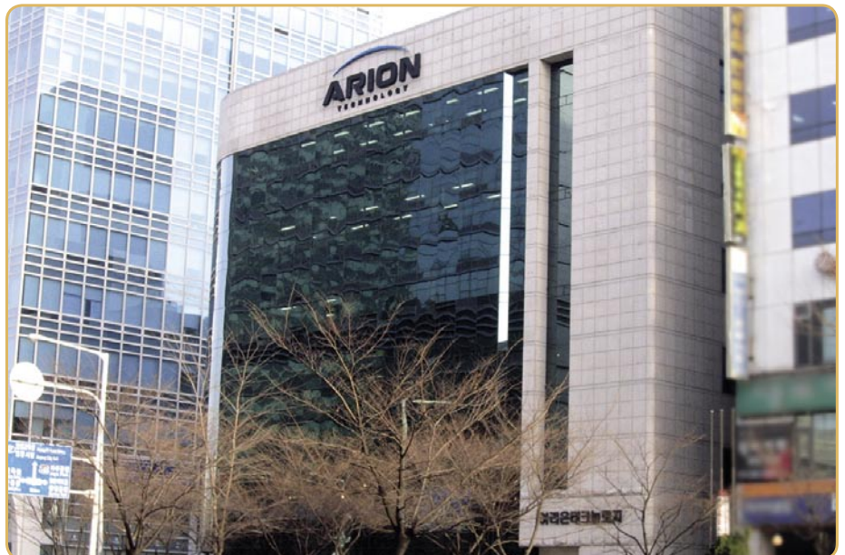
Das ARION Gebäude im Süden Seouls